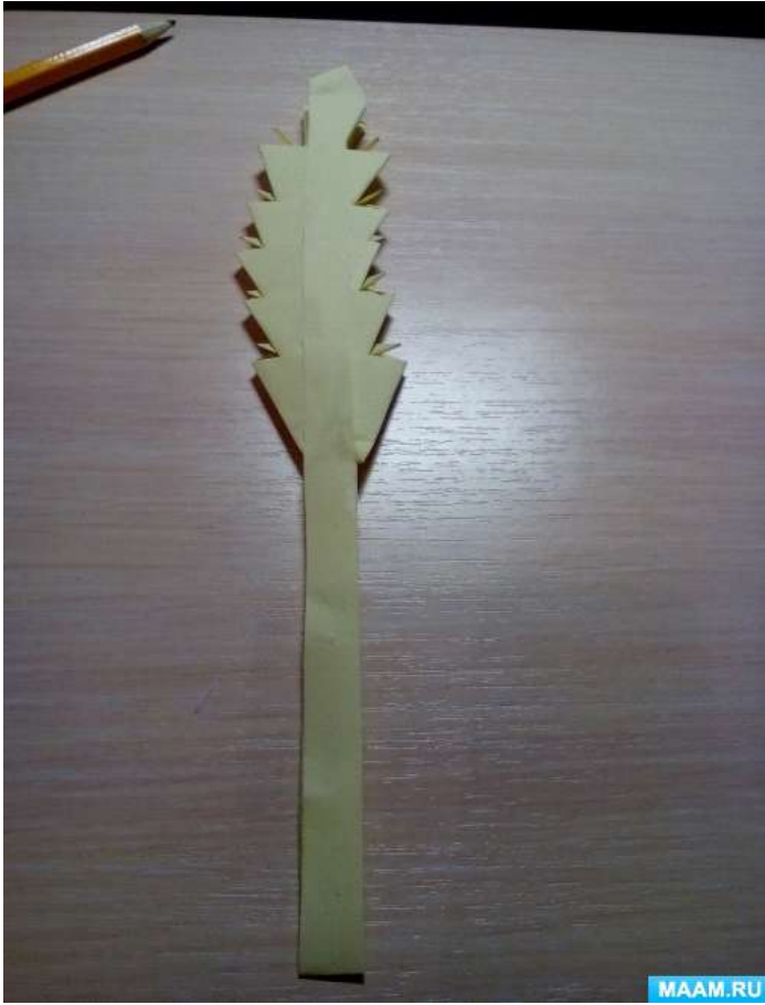
13. Колосок готов