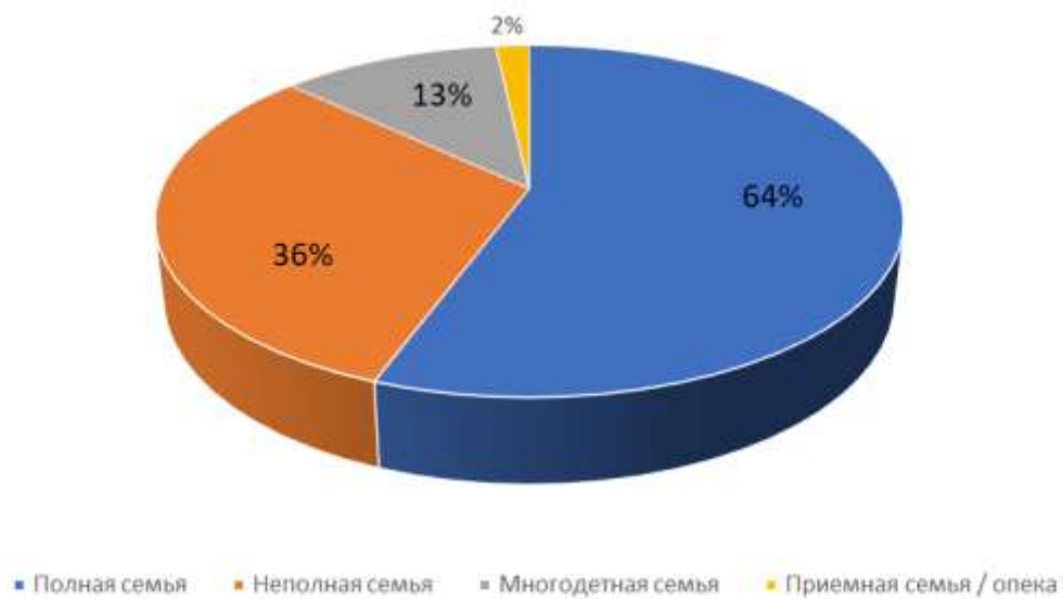
Социальный статус родителей